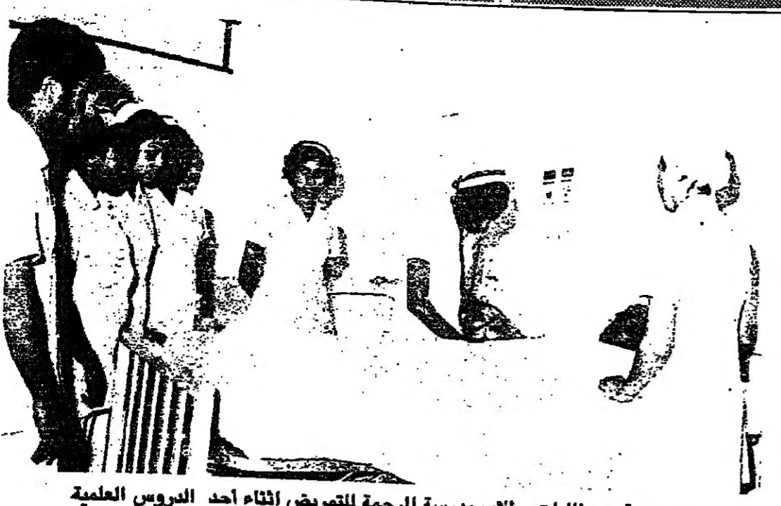
مجموعة من طالبات وطلاب مدرسة الرحمة للتدريب أثناء الدروس العلمية

توفير العلاج والراحة لكل الراقيين على اسرّة الشفاء مدنسة الرحمة لتدريب خرجت جيلا كفووا من ملائكة الرحمة